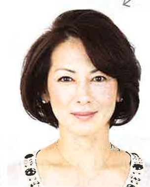
手ぐしで整えて完成!