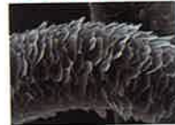
キューティクルが荒れた状態