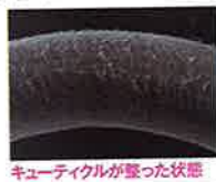
キューティクルが整った状態

髪を守るひだ状のキューティクルは、夏の紫外線ダメージで下の写真のようにささくれ、さらに悪化すると剥げ落ちて髪が空洞化してしまう。 (参考資料:日本毛髪科学協会)