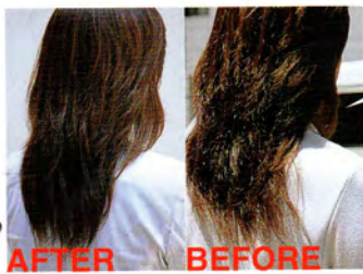
AFTER 髪全体のトーンが揃い、つやアップ! 手ざわりもシルク並みに! BEFORE アイロンの使いすぎで退色した毛先がやばい! 女っぷり下降中