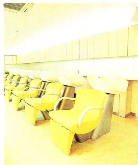
▲マイナスイオン軟水器が設置されているシャンプー台