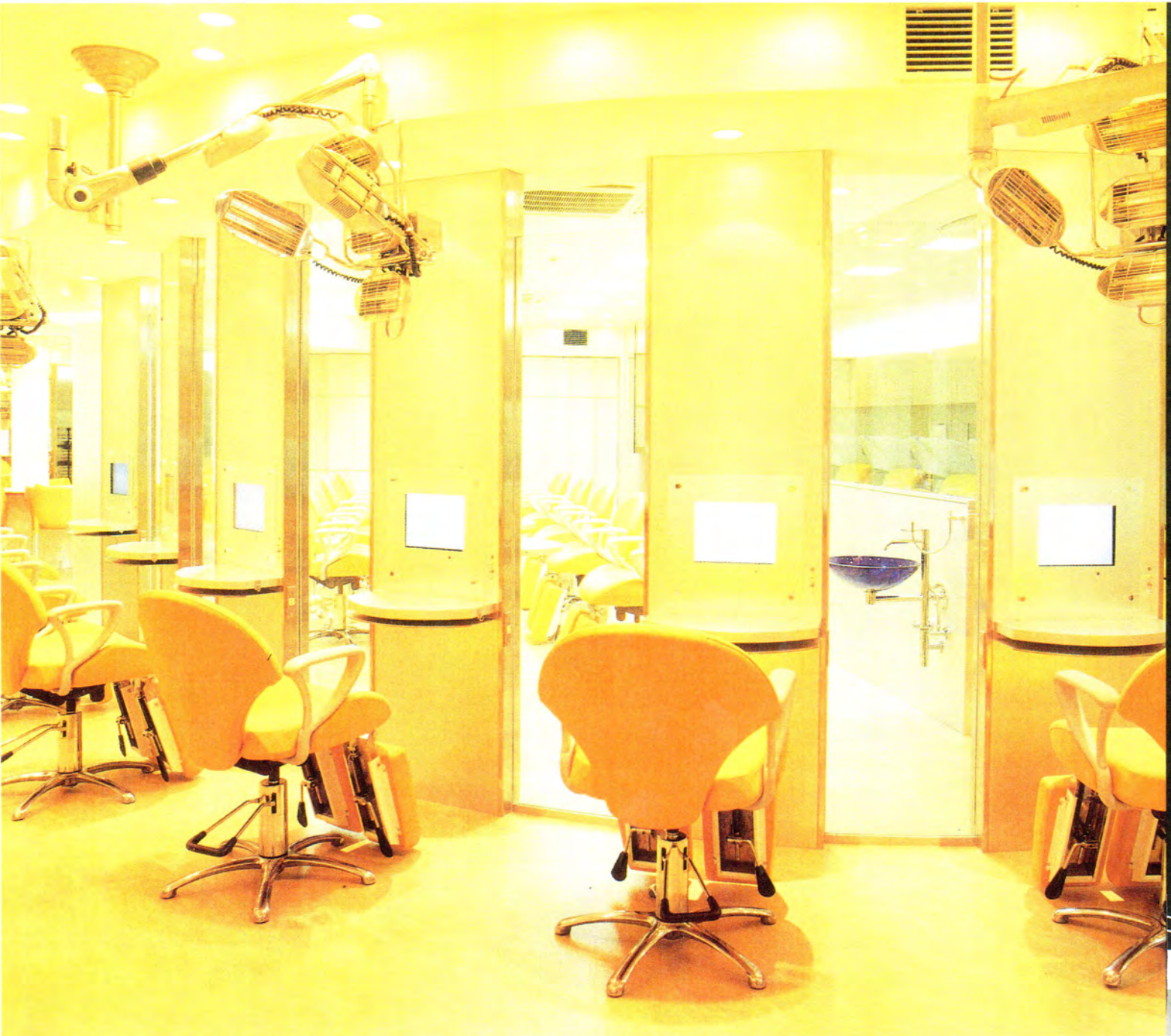
▲トリートメントやパーマ、カラーなどを行うスペースには鏡の代りにモニターが設置されている。フットレスト付きのチェアはイタリア製