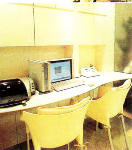
◀顧客の施術履歴データや毛髪を科学的に分析・ 診断するマイクロスコープ、強伸度計などが 備わった「インスペクション(検査)コーナー」