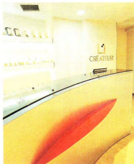
▲アール状のレセプションカウンター