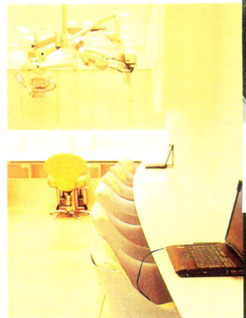
▲多目的スペースのカウンターにも微妙なアールがつけられて