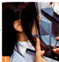
1 顔全体の印象を左右する、フェースラインのボリューム、長さをはじめに決定。髪の内側に、浅めのシャギーを丹念に入れられ、毛先全体に軽さを与える。

▼サロンで使用、販売されているケア剤。(右)洗い流さないトリートメント。アクアエイド24g ¥2,000・(左)艶を与えろ。キューティジェル100ml ¥3,500