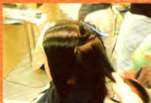
たんぱく質を髪の深部に丁寧に塗り込み、その後、傷んだキューティクルをリペアする溶液を毛先を中心になじませる。

まずはじめにヘアの状態つぶさにチェックし、状態によってメニューを決定。記者Aの場合、シャギーを入れた毛先部分が傷んでいるとの診断が。たんぱく質を補給→キューティクルの修復→エステ剤をつけ加温というメニューを受け、約1時間後に終了。髪がバジーンに生まれ変わったみたい！ 周囲には、ボリュームが3割減ったと評判！