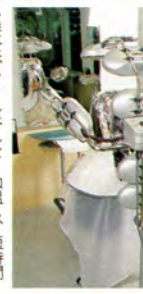
→髪全体をまんべんなく加温し、短時間で薬剤を浸透させる特殊赤外線加温器。