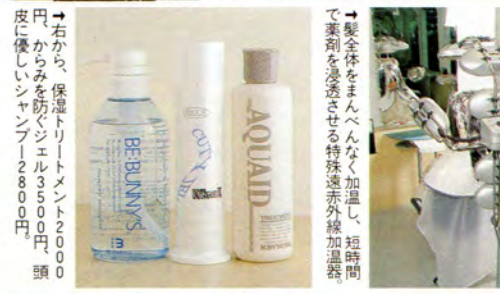
→右から、保湿トリートメント2000円、かみを防ぐジェル3500円、頭皮に優しいシャンプー2800円、頭

●料金 ドクターズストレート2万8000円～3万5000円(カット別、シャンプー、ブロー込み)、カット5000円～、ドクターズカラー1万2000円～1万6000円(ヘアエステ、シャンプー、ブロー込み) ●規模 席数20、技術者数9