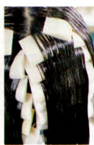
↑樹脂のコーティング効果でバネルやアイロンいらす。ブローによって形を記憶させるのでラク。

強いクセ毛をストレートにする縮毛矯正。髪を傷めないことで評判なのが、このドクターズストレート。薬剤をつける前に、水分やたんぱく質など髪に不足しているものを必要なぶん補い、髪を保護する。そして、髪をまっすぐにするつかい棒の役割をする樹脂の一種を配合した薬剤を塗布。加温して洗い流し、ブローでストレートに。髪を伸ばすアイロンは使わないから、ダメージが少なく、普通は避ける同日のカラリングもOK。