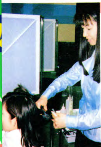
担当の技術者が髪に関する悩み や希望を、ていねいに聞いてく れるので安心。

硬い髪を柔らかくしたい人や柔ら かい髪にハリを出したい人、パーマ、 カラーによる髪の傷みや枝毛、切れ 毛で悩んでいる人は、この店オリジ ナルの「ヘアエステ1万円」に注 目。傷んでしまった髪を内部から修 復し、栄養を与えてキューティクル を整えるテクニクが施され、いつ