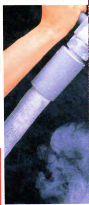
傷んだ髪、硬い髪、枝毛・切れ毛もまとめてハイバイ。マッサージやトリートメントで気持ちよく