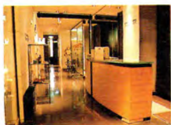
それぞれにあったスタイルを 可能な限り提供するという ことがモットーのサロン。