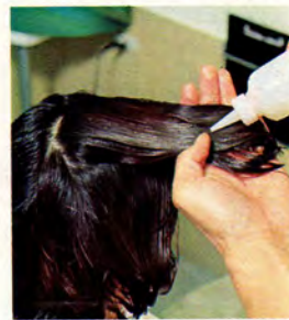
調査したトリートメント剤を髪にまんべんなくつけます。

ネイル「ラメルト」とひと味のお部屋リラック 爪はこの時すっかりみちがえるよう。これにパラフィンパックを加えてもちょうど5,000円だからトライしてみたい価値はありそう。またサロンではマニキュアや足にやさしいサンダルなどのグッズも販売。うわさのネイルブランド「essie」も入荷中。 爪はこの時すっかりみちがえるよう。これにパラフィンパックを加えてもちょうど5,000円だからトライしてみたい価値はありそう。またサロンではマニキュアや足にやさしいサンダルなどのグッズも販売。うわさのネイルブランド「essie」も入荷中。