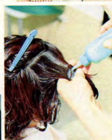
2番目の液は保湿剤や栄養剤を主に配合したもの。