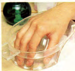
やすりで整えた爪先をお湯に浸します。

●東京都渋谷区神宮前5-7-5、原宿コロンビルB1 ●03-3480-8182 00 AM - 8:00 PM (受付は7:00 PM) 日曜定休、ヘアエステは ¥8,000 / ¥12,000。