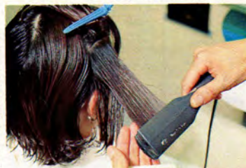
アイロンで、ギザギザになったキューティクルを修正してくれます。