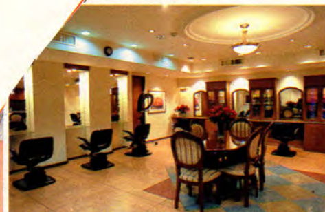
には必ずカウンセリングを行い、髪の状態や色を入念にチェックする。