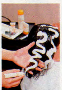
パーマ直後、専用の施術。ウェーブの美しさを引き立てながらトリートメント。