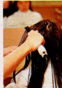
酸素水は通常の水に比べて8倍の量の酸素を含む。髪にはもちろん、肌にもいい水。

トリートメント ¥4,000 (プロ別) カットやパーマとの組み合わせも可能。 ●東京都渋谷区千駄ヶ谷3-56-12 プレ ジール原宿 営11:00AM-9:00PM 火曜 休