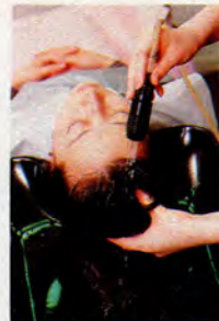
椅子を倒してπウォーターのマッサージを受けていると、眠ってしまうほど心地よい。