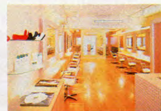
原宿のほか、たまプラーザにもサロンが。