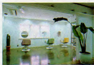
一軒家のような造りがユニーク。9月にはサロン名のみ変更予定。