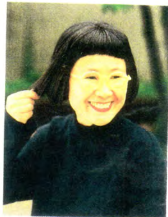
つやつやサラサラの髪になって大橋の大橋さん。